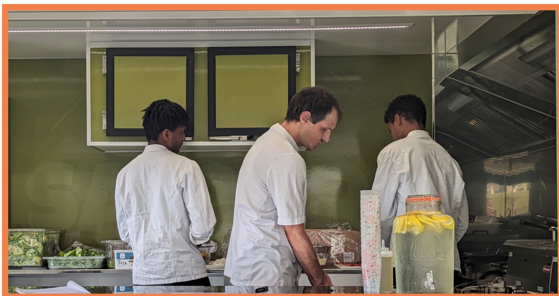
Situation des jeunes :

69% de jeunes du Prado 31% de jeunes hors Prado